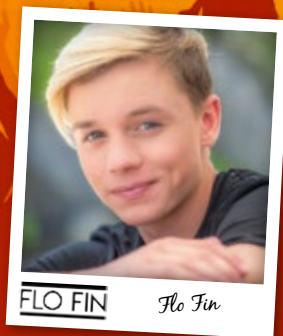
FLO FIN Flo Fin