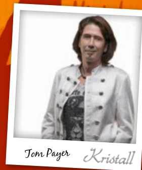
Tom Payer Kristall